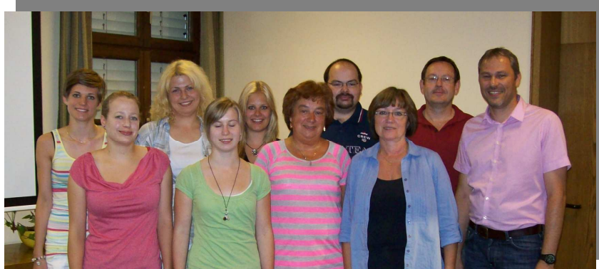
Betreuer für das Ferienprogramm 2013

Sendet bitte den Newsletter an Eure Mitglieder, Teilnehmer und Freunde weiter. Es sind für sie bestimmt einige nützliche Informationen dabei.